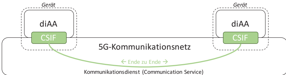
diAA – distributed automation application/function (verteilte Automationsanwendung / - funktion) CSIF – Communication Service Interface (Kommunikationsdienstschnittstelle, Referenzschnittstelle)

Während der Erarbeitung von TR 22.804 stellte sich zum Thema Dienste folgendes heraus: Zum einen hat 3GPP kein normiertes Referenzmodell von Dienstbeschreibungen. Es ist also nicht klar, welche Aspekte eines Dienstes zwingend beschrieben werden müssen. Außerdem stellte sich heraus, dass Kommunikationsdienste oftmals durch Netzwerk- und nicht Dienstanforderungen beschrieben werden. Letzteres hat zur Folge, dass in diesen Fällen keine zwingenden Ende-zu-Ende Anforderungen aus den 3GPP-Dokumenten ableitbar sind. Zum anderen werden auch in der industriellen Automatisierung oftmals Dienstanforderungen entweder durch reine Anwendungsbeschreibungen (Stichwort: zyklische Anwendungen) oder durch Netzwerkanforderungen oder durch eine stark integrierte Kombination von beiden beschrieben.