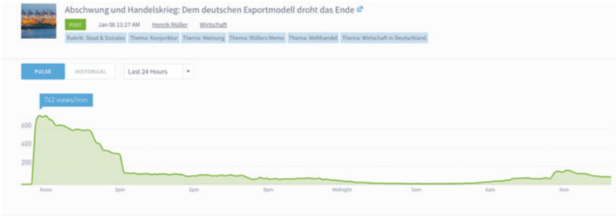
Abb. 2 Nutzungsintensität der Kolumne vom 6. Januar 2019 im Zeitablauf (Screenshot des Analysetools Parse.ly)

modell droht das Ende“) das Glück, um 11.27 Uhr auf Position 1 online zu gehen (Abb. 2). Allmählich bröckeln im Zeitablauf die Zugriffe, sodass der zuständige Chef vom Dienst den Text allmählich auf tiefere Positionen schiebt und irgendwann ganz von der Homepage verschwinden lässt. Gegen 15 Uhr geht die Nutzungsintensität daher stark zurück. Texte, die initial viele Leser erreichen, haben bessere Chancen, in die Empfehlungslisten („meist gelesen“, „meist empfohlen“) aufzutauchen, was einen zusätzlichen Schub bei den Leserszahlen entfacht.