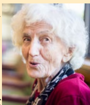
(Symbolbild mit Fotomodell)

Aus Scham verschweigen viele betagte Frauen ihre gynäkologischen Symptome. Der Hausarzt kann helfen, indem er auf häufige gynäkologische Probleme