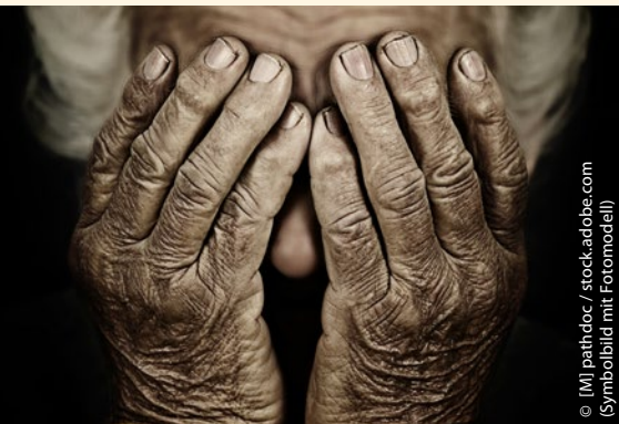
© [M] pathdoc / stock.adobe.com (Symbolbild mit Fotomodell)