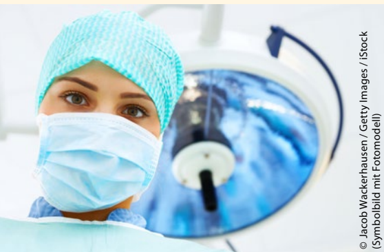
© Jacob Wackerhausen / Getty Images / iStock (Symbolbild mit Fotomodell)

Hinter Lebensmüdigkeit im Alter steckt beinahe immer das Bedürfnis, über eine existenzielle Notlage zu sprechen. Gelingt es, eine vertrauensvolle Beziehung aufzubauen, können häufig Alternativen zur Selbsttötung gefunden werden.