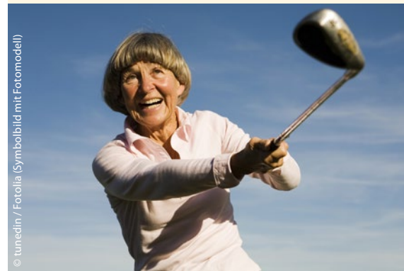
(Symbolbild mit Fotomodell)