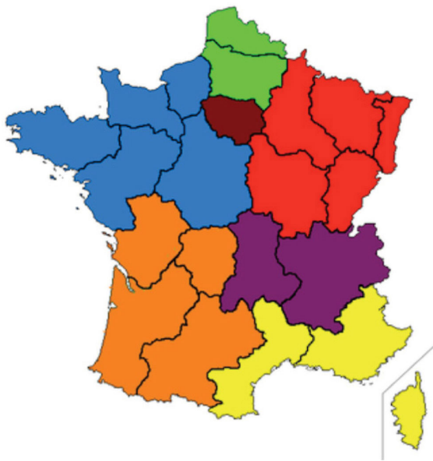
Fig. 2 Zones de défense et de sécurité en France métropolitaine. Les principaux éléments sont repris dans la Fig. 1

du système de santé en situations sanitaires exceptionnelles) formalise la coordination des dispositifs existants dans les trois secteurs sanitaires, ambulatoire (la médecine libérale), hospitalier et médicosocial. Ce dispositif comprend cinq volets répondant à des situations sanitaires particulières :