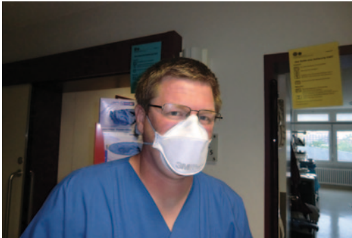
Abb. 8.1 Maske