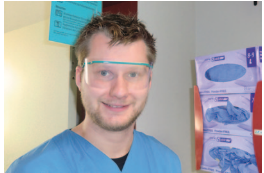
Abb. 8.2 Schutzbrille